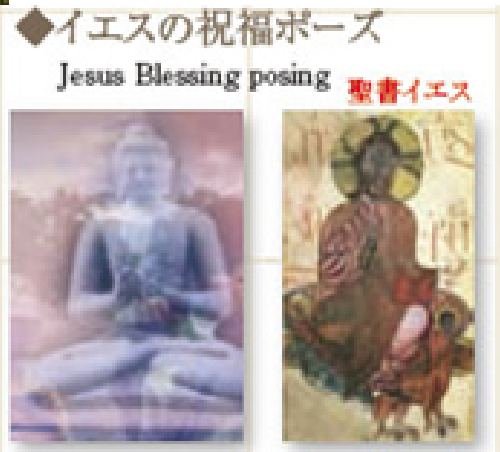
Borobudur Temple, Java, Indonesia